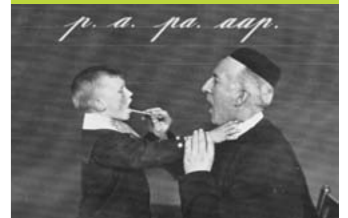
Articulatieles in het dovenonderwijs, waarin een juiste stand van de mond en het voelen van vibraties een belangrijk hulpmiddel vormde, omstreeks 1910