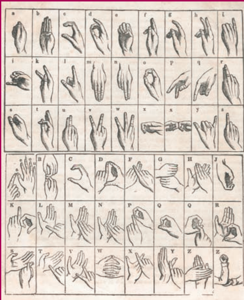
Drie versies van het handalfabet