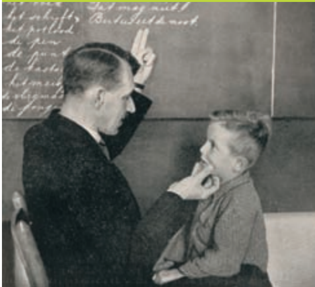
Spreekonderwijs in Effatha: oefenen van de klank ee, circa 1930

van dove kinderen. Een verschil was dat het Groningse Instituut zich op dove kinderen uit de hele Nederlandse bevolking richtte, terwijl de overige twee duidelijk een levensbeschouwelijke grondslag hadden, katholiek of protestants. Als we kijken naar de argumentatie voor de oprichting van de instituten dan blijken er eigenlijk weinig verschillen in levensbeschouwelijke motivatie te zijn. Guyot benadrukte dat hij 'God alleen de ere' wilde geven, de oprichters van het katholieke instituut spraken over 'de zegen des Almagtigen' en Effatha legde het accent op 'der christenen dure plicht'. Het resultaat was dat er een belangrijk fundament lag voor de verdere uitbouw van het speciaal onderwijs, waartoe het dovenonderwijs een langgerekt startsein gaf. L