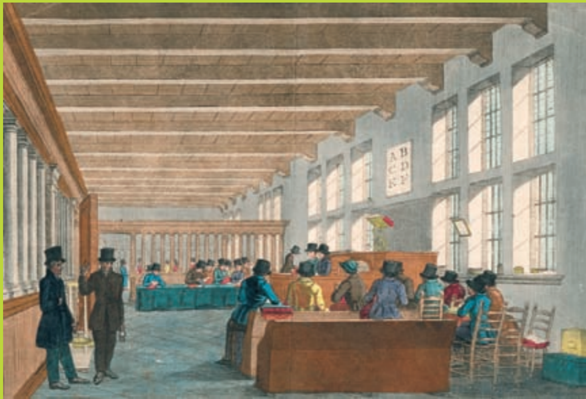
Klaslokaal van het Groningse Instituut voor Doofstommen, circa 1800

De katholieke emancipatie In de eerste helft van de negentiende eeuw groeide het katholieke zelfbewustzijn en namen katholieken geen genoegen meer met een tweederangs positie. Formeel waren alle burgers sinds 1795 gelijk voor de wet, maar katholieken merkten daarvan niet veel. Het ongenoegen hierover uitte zich in de afscheiding van België (1830) en een groeiend verzet tegen de openbare school ten gunste van eigen katholieke scholen. De koningen Willem II en III, die respectievelijk regeerden van 1840 tot 1849 en van 1849 tot 1890, waren gevoelig voor de grieven. Tijdens hun bewind werd het mogelijk om een voorzichtige start te maken met de wederopbouw van de kloosters. In 1853 werd de episcopale structuur hersteld met de vestiging van bisdommen in Utrecht, Haarlem en Den Bosch. 11 Ongetwijfeld heeft dit groeiend katholieke zelfbewustzijn ook het tot stand komen van het katholieke Instituut voor Doofstommen bevorderd. Omstreeks 1825 deed monseigneur Henricus den Dubbelden een beroep op priester Martinus van Beek, conrector van de Latijnse school in Gemert, om onderwijs te geven aan doven. Als reden noemde hij de aanwezigheid van vier volwassen doven in de parochie Gemert die niet toegelaten konden worden tot het ontvangen van de heilige sacramenten. 12 Van Beek bestudeerde literatuur over het dovenonderwijs, ontwikkelde zijn eigen gebarensysteem, en begon in 1828 het onderwijs aan een klein groepje doven. 13