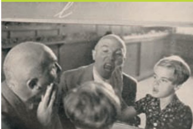
Oefenen in spreken voor de spiegel, circa 1930

De oprichters spraken over 'der christenen dure plicht': het was niet meer dan een vanzelfsprekende opgave